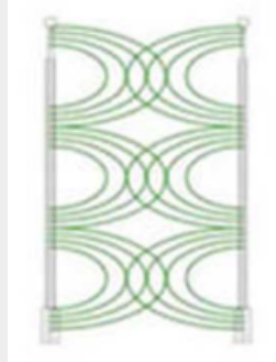
SYSTÈME DE DÉTECTION ACTUEL